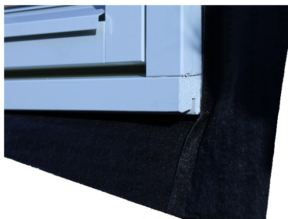
Fig.3 Eksempel på et vindu med forhåndspåmontert vindspærre-/tapestrimmel på karmen.

Alle vinduene og vindusdørene som omfattes av denne godkjenningen kan brukes i vertikale fasader/yttervegger, der det ikke er stilt krav til brannmotstand og/eller røyktetthet. Vindusdører og vinduer, unntatt fastkarmversjonen, kan brukes som rømningsvei når de monteres i henhold til aktuelle forskrifter. Se forøvrig Byggforskserien 520.391 Rømning via vindu. Krav og utforming.